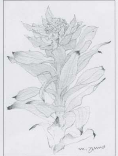
「ちくま日本文学全集」(筑摩書房、1991)装画原画 左:梶井基次郎・右:尾崎翠 ©ANNO & ART MUSEUM