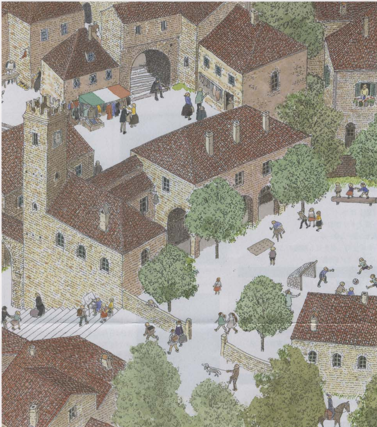
「旅の絵本II」(改訂版、福音館書店、2006)より