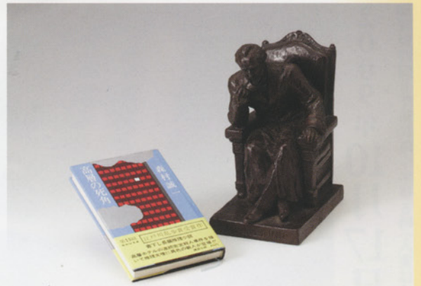
第15回江戸川乱歩賞「高層の死角」とトロフィー