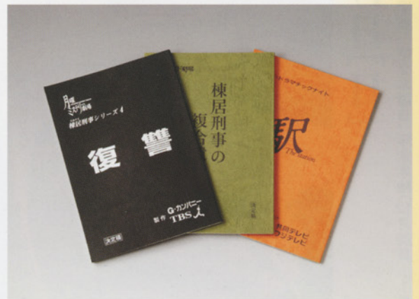
棟居・牛尾刑事シリーズ台本